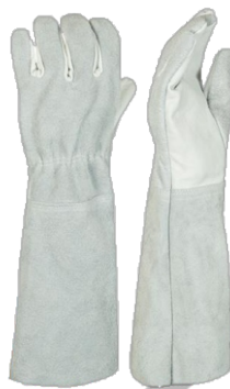
MISTA (RASPA E VAQUETA)