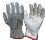
MISTA VAQUETA E RASPA