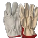
MISTA VAQUETA E LONA