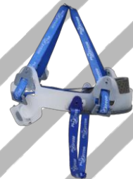
SUSPENSÃO E JUGULAR MAX