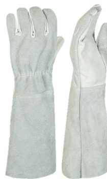
MISTA (RASPA E VAQUETA)