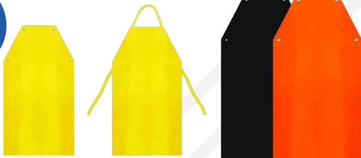
PVC Forrado ou Laminado com Ilhós ou Tiras Soldadas